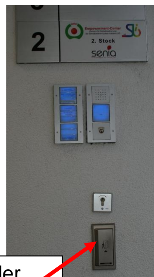
Das ist der Tür-Öffner

Wir sind im 2. Stock. Es gibt einen Lift oder Stiegen.